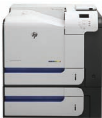
HP LaserJet Enterprise 500 color M551xh