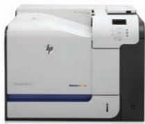
HP LaserJet Enterprise 500 color M551dn